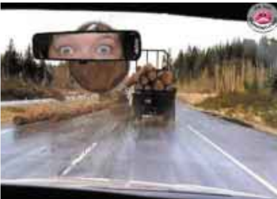
La bûche de Noël.

Les activités syndicales se poursuivent, et j'en profite pour rappeler quelques éléments de vos droits, en matière de congés de maladie, entre autres.