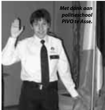
Met dank aan politieeschool PIVO te Asse.

Vele leden namen contact met ons op om hun onverholven kritiek op deze verklaringen te spuien: U vond deze stellingneming, zo snel na de feiten, waarop bovendien op geen enkel ogenblik werd teruggekomen, niet méér dan de woorden van - en we herhalen uw woorden - "een leidinggevende die de problemen op het werkveld waarop hijzelf nooit één enkel ogenblik werkzaam was, eenvoudigweg niet kent" .