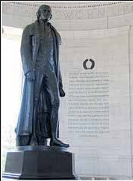
Thomas Jefferson 1802

I believe that banking institutions are more dangerous to our liberties than standing armies. If the American people ever allow private banks to control the issue of their currency, first by inflation, then by deflation, the banks and corporations that will grow up around the banks will deprive the people of all property until their children wake-up homeless on the continent their fathers conquered. "